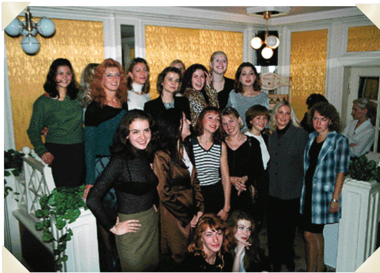
Redo för en helkväll med skandinaviska män. Utplöckade ur kontaktförmedlingens register på drygt 2 000 kvinnor som tröttnat på ryssar.