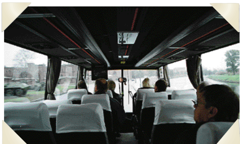
Sightseeing, men S:t Petersburgs yttre fägring lockar få av de svenska männen.