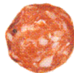
Italiensk brunch CAFÉ PONTINO

Välj mellan tre olika bruncher för 75:- inkl måltidsdryck och kaffe.