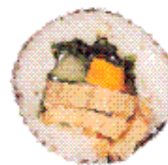
Sushi brunch NORMAN'S DEU