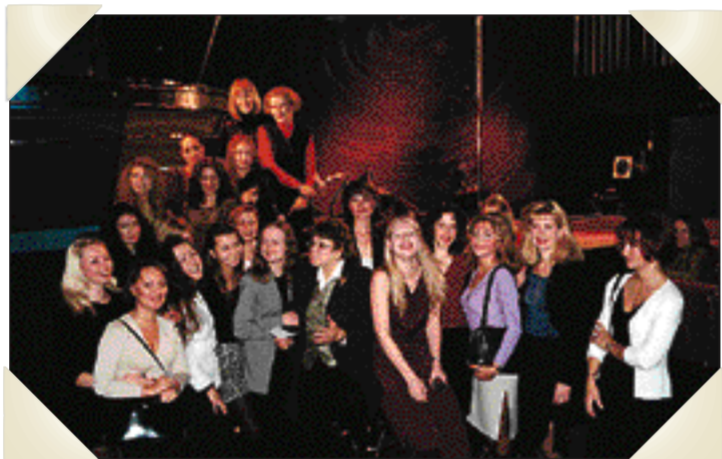
Den första träffkvällens sällskap med kvinnor i väntan på elva skandinaviska män som kan förändra deras liv – och vice versa.

"Jag vill aldrig mer ha en rysk man. De gör ingenting i hemmet och struntar i kvinnan. Dessutom vill jag härifrån."